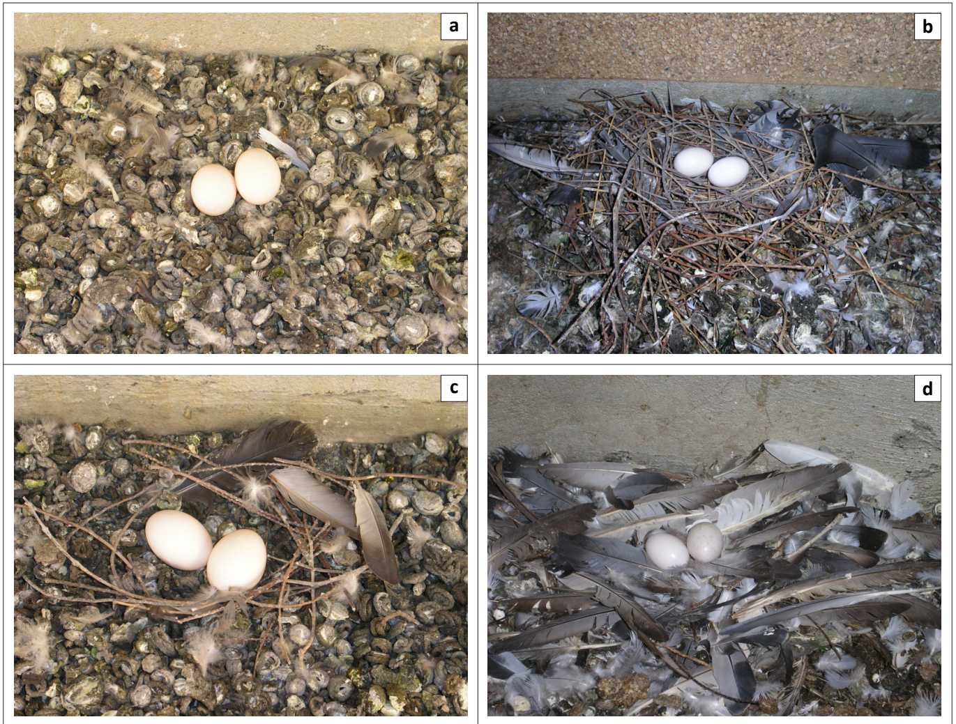
FIGUUR 2: Nestipes van tuinduiwe in die Bloemfonteinse studiegebied, (a) geen spesifieke nesmateriaal (droë voëlms); (b) stewige nes van droë takkies; (c) losse samestelling van takkies en vere en (d) nesmateriaal beperk tot vere.

die literatuur vermeld word (Maclean 1993; Snow & Perrins 1998). Hoewel 'n redelike mate van onderlinge variasie in eierlengte (34.4 mm – 43.0 mm) en -breedte (25.2 mm – 38.4 mm) voorgekom het, was daar min verskille in afmetings binne 'n bepaalde broeisel. Die broeiproses van die tipiese broeisel het gewoonlik eers ná die verskyning van die tweede eier, sowat twee dae ná dié van die eerste, 'n aanvang geneem en is deur beide geslagte behartig. Wyfies het normaalweg vanaf skemer tot laat die volgende oggend gebroei, waarna die mannetjies vir die res van die dag oorgeneem het. Met gemiddelde daglengtes van 11 uur 30 minute was die totale daaglikse broeiperiode van die onderskeie geslagte bykans dieselfde (mediaan van 342 minute en 339 minute vir mannetjies en wyfies respektiewelik; n = 21 ). 'n Progressiewe afname in eiermassa vind tydens die normale broeydperk van 16 dae tot 19 dae plaas. Volgens regressievergelykings ( y = -0.19 + 18.78 en y = -0.21 + 18.39 ) het die eerste en tweede eiers onderskeidelik 17.7% en 18.3% van hul oorspronklike massa (vanweë respiratoriese waterverlies) verloor ( n = 65 neste). Net meer as die helfte (54.9%) van die waargenome eiergetal van 477 het uiteindelik suksesvol uitgebrou. Faktore wat tot hierdie lae syfer bygedra het, sluit in: voëls wat die broeiproses weens die periodieke oorstroming van